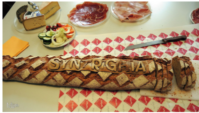
Abb. 3. Eine „brötige“ Huldigung an die behandelte Gattung