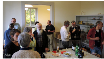
Abb. 4. Der fachliche Austausch in der Mittagspause

An beiden Tagen wurde ein köstliches Picknick in der Villa Rainhof organisiert und überraschte mit einem aussergewöhnlichen Brot, das auf eigenwillige Weise der behandelten Pottiaceen-Gattung huldigte (Abb. 3). Das Wetter spielte auch mit, in der Pause konnte der Obstsortenmarkt auf dem Gelände des Botanischen Gartens besucht sowie ein vielfältiger Austausch mit bryologischen Kollegen aus dem in- und Ausland gepflegt werden (Abb. 4).