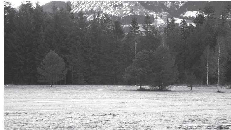
Das Tällemoos Anfang Januar 2008.

Im Rahmen des Artenschutzes von Flechten im Kanton Luzern, galt es den aktuellen Zustand der Population im Tällemoos, fast zehn Jahre nach der letz-