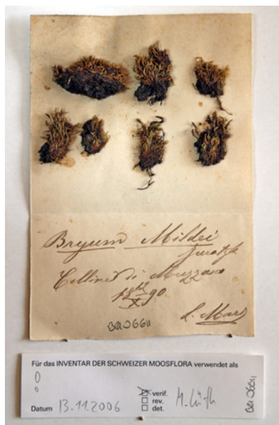
Fig. 1: Bryum mildei , Erbario generale.

torio, messa in evidenza con i dati degli erbari storici. La nomenclatura è stata aggiornata secondo la Lista Rossa delle briofite minacciate in Svizzera (Schnyder N. et. al., 2004). Per i campioni raccolti in Ticino sono state aggiunte nella banca dati le coordinate geografiche, con l'ausilio di programmi di georeferenziazione.