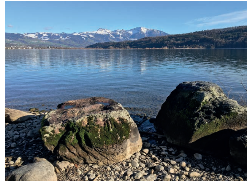
Abb. 2. Findlinge am Ufer des Zürichsees mit Dialytrichia mucronata.

Eigentlich auf der leider erfolglosen Suche nach dem Strandling ( Litorella uniflora ) am Zürichsee zusammen mit Niklaus Müller, sahen wir uns nebenbei am Ufer vor Oberbollingen eine Gruppe von halb im Wasser liegenden Findlingen an (Abb. 2). Neben verschiedenen pleurokarpn Wassermoosen (u.a. Hygrohypnum luridum , Hygroamblystegium tenax ) fanden sich oberhalb der Wasserlinie auch dunkelgrüne Polster von Hyophila involuta und hellgrüne Polster einer zunächst nicht erkannten Art, die sich bei der anschliessenden Bestimmung als Dialytrichia mucronata herausstellte.