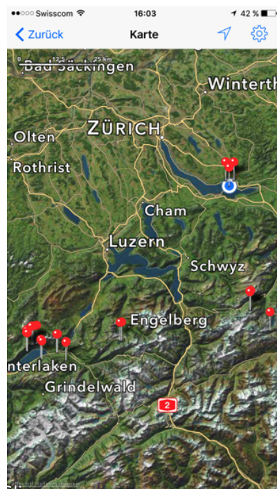
Erfassung der Angaben zu einer Art (links) und Fundkarte (rechts)

verwendet werden kann. Nach der Synchronisation werden die Funde im Online-Feldbuch aufgeführt und können noch für kurze Zeit bearbeitet werden, bevor sie in die jeweiligen Datenzentren (Datenzentrum Moose, SwissLichens und SwissFungi) geliefert werden. Sobald sie überliefert worden sind, erscheinen die Datensätze im Online-Feldbuch in grauer Schrift und können nicht mehr bearbeitet werden.